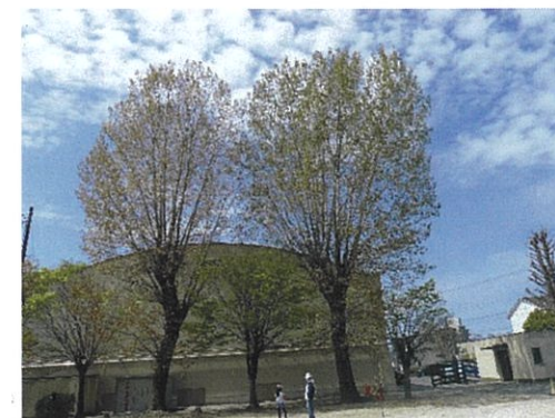
瀬田小学校カロリナポプラ