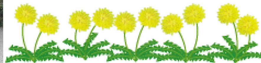
瀬田小学校 くすのき