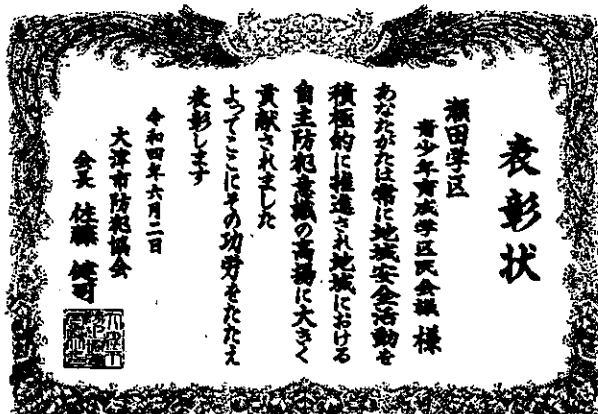
瀬田学区青少年育成学区民会議 様