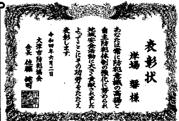
岸場 馨 様