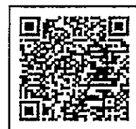
令和5年度の ワクチン接種について

【お問合せ先】大津市新型コロナウイルスワクチンコールセンター ☎0570-002-092