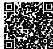
市民税・県民税 申告書作成システム