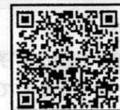
ぽけっとポリスしが

滋賀県警察公式アプリ「ぽけっとポリスしが」が3月1日にリリースされました。「防犯マップ機能」や「防犯ブザー・ちかん対策機能」「現在地送信機能」など、あなたとあなたの大切な人を守る機能が詰まったアプリとなっていますので、ご家族やご近所の方、ボランティア仲間の皆さままでぜひダウンロードしてご活用ください!